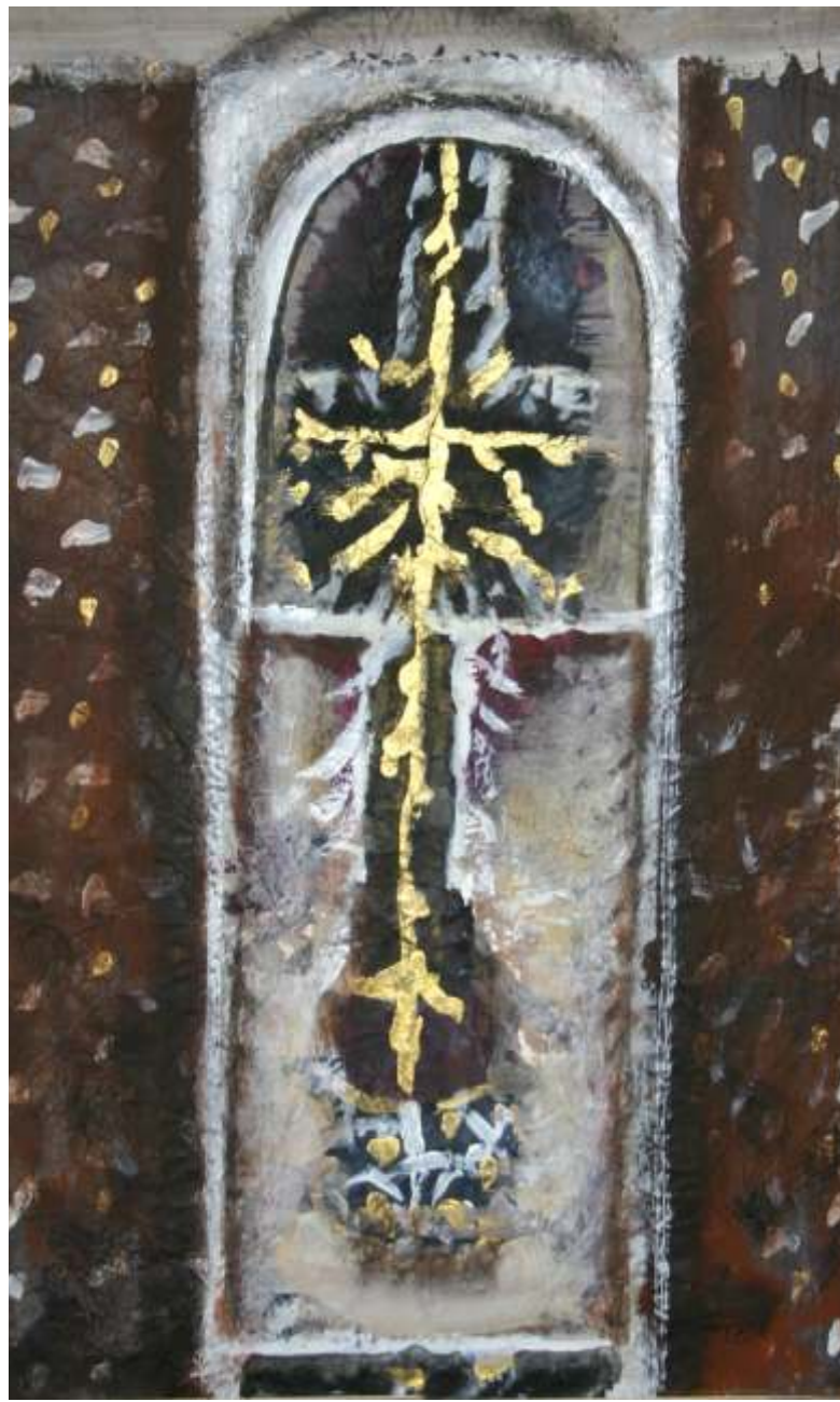
Crucea por ii 70/50 cm acrilic pe pânză