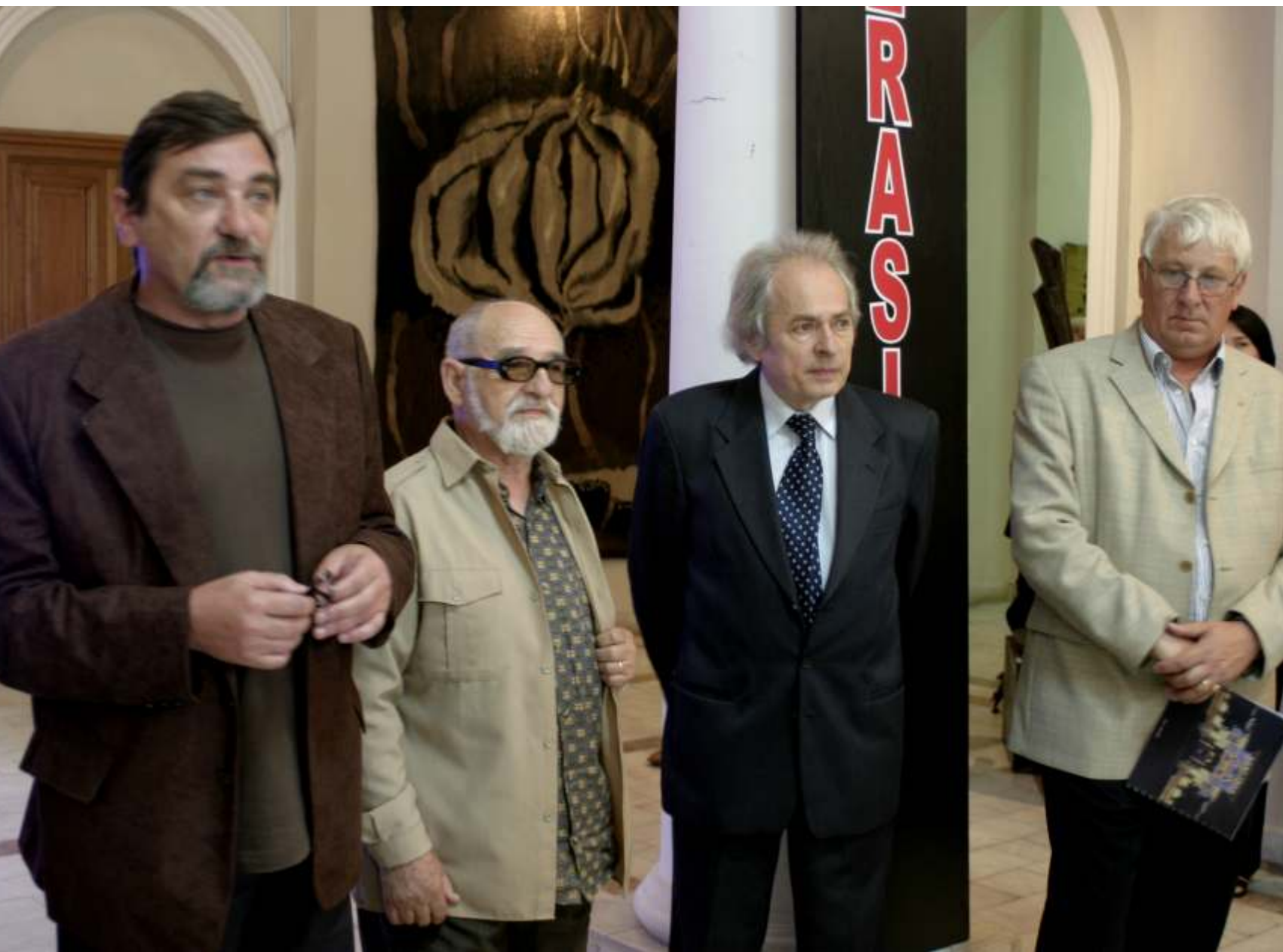
foto vernisaj, Galati, Muzeul de Arta Vizuala, 14 iunie 2006, ora 12,30