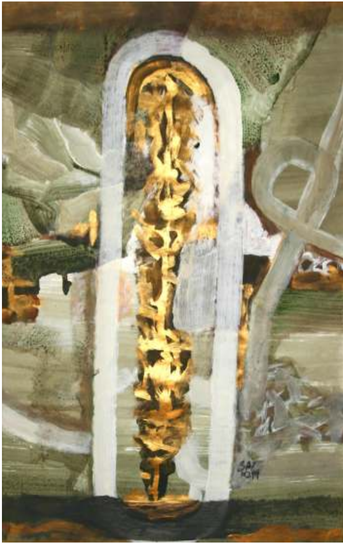
Poarta de bronz 70/50 cm acrilic pe hârtie