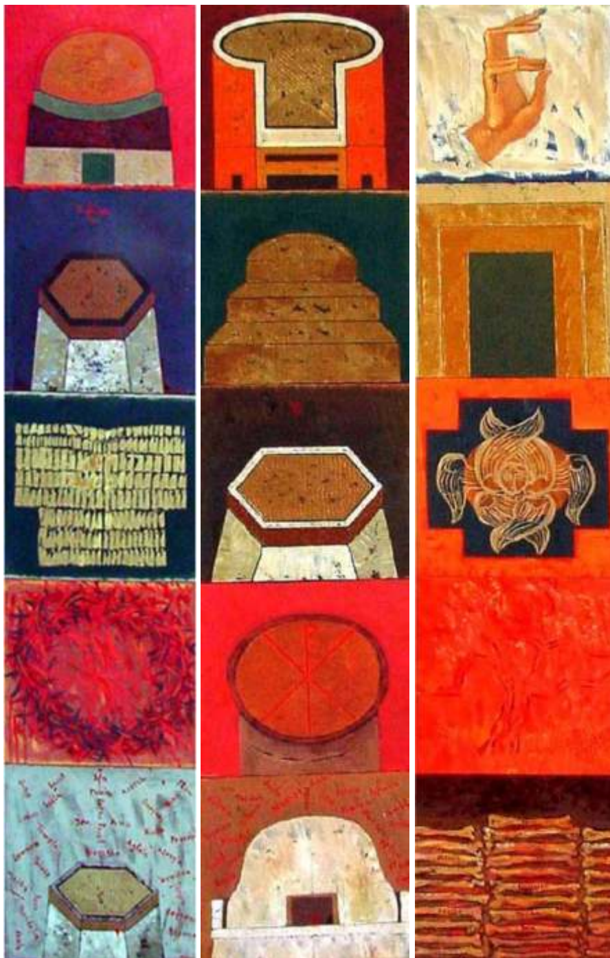
Scara 275/55 cm ulei pe pânz