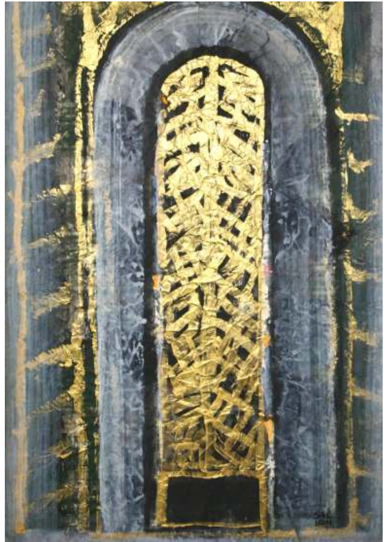
Poart aurit 70/50 cm acrilic pe hârtie