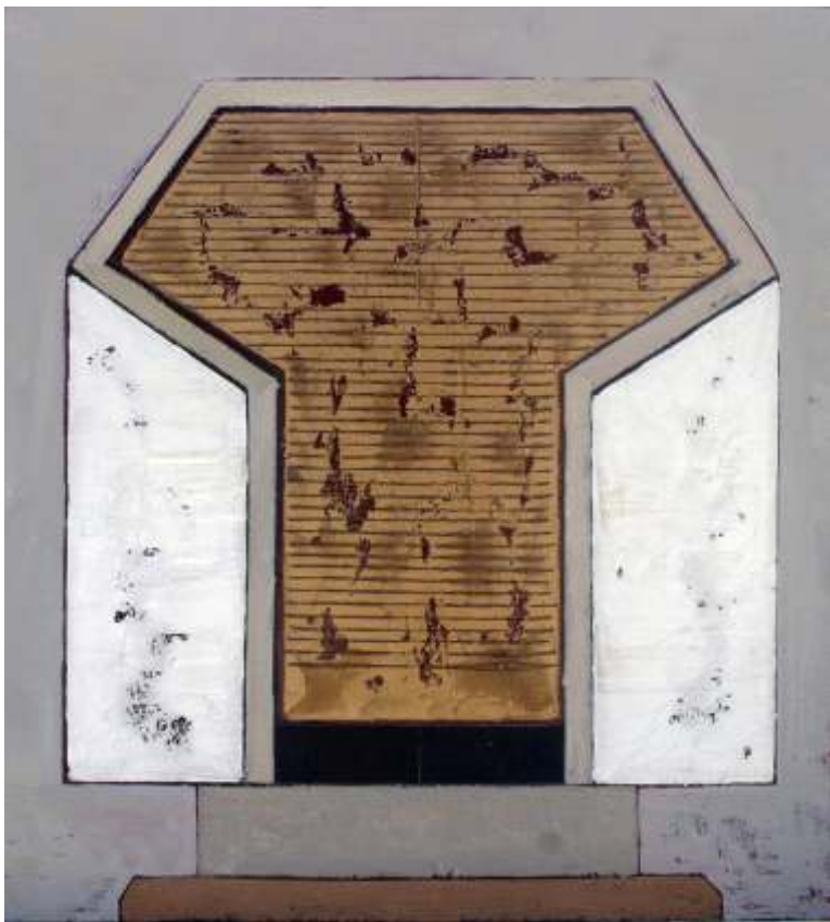
Tron 70/65 cm mixt /pânz