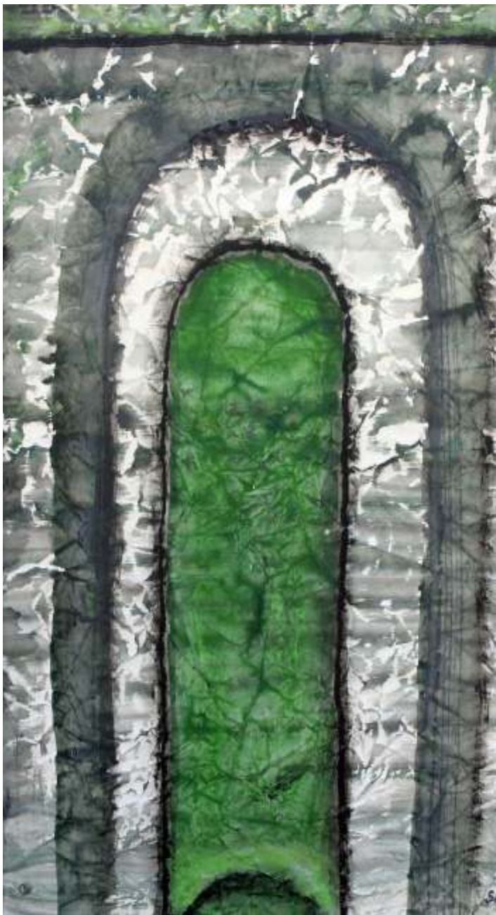
Poart verde 70/50 cm acrilic pe hârtie