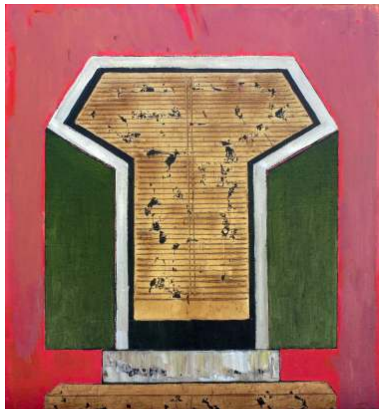
Tron 70/65,5 cm mixt -pânz