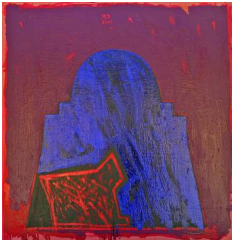
Memoria absidei 4 50/46 cm ulei pe pânz