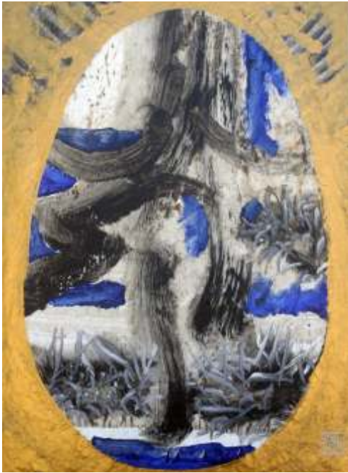
Planeta pe cer de aur 70/50 cm acrilic pe hârtie