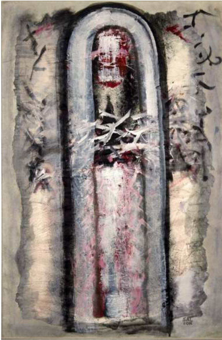
Flori de piatr 70/50 cm acrilic pe hârtie