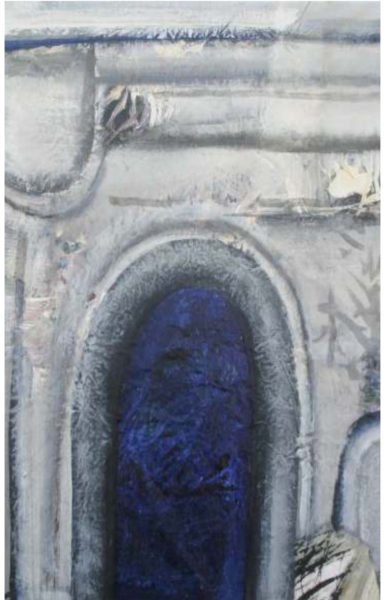
Poarta adânc 70/50 cm acrilic pe hârtie