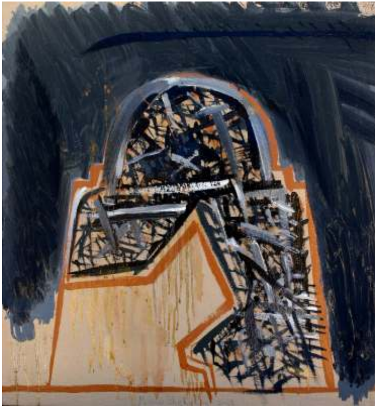
Absid 81/81 cm, ulei pe pânz