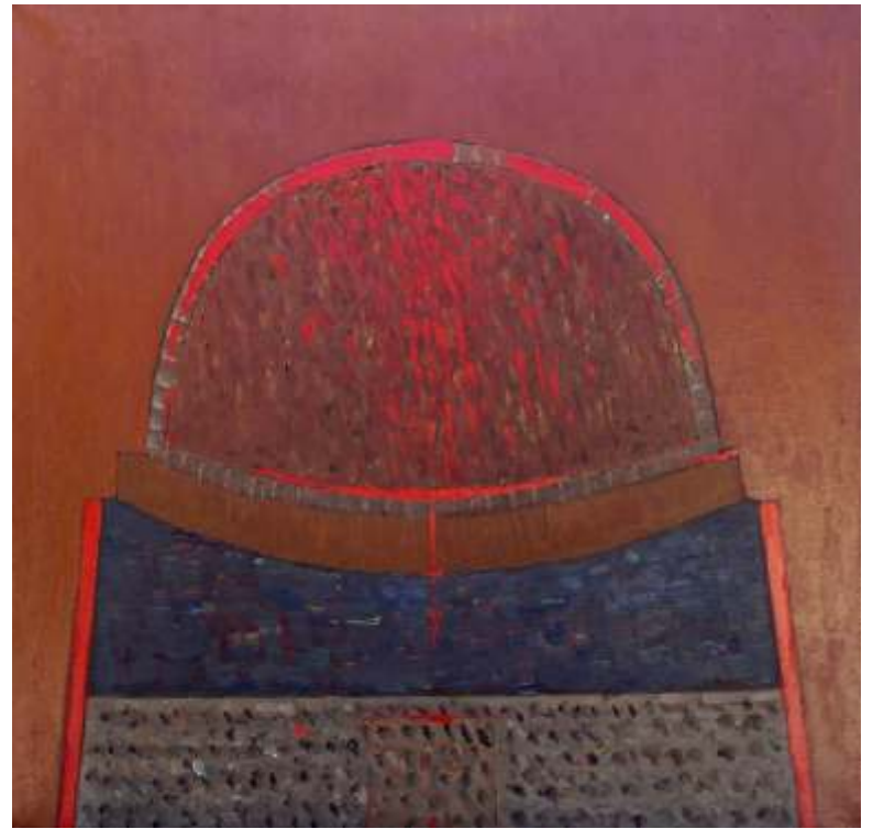
Memoria absidei 50/50 cm, ulei pe pânz