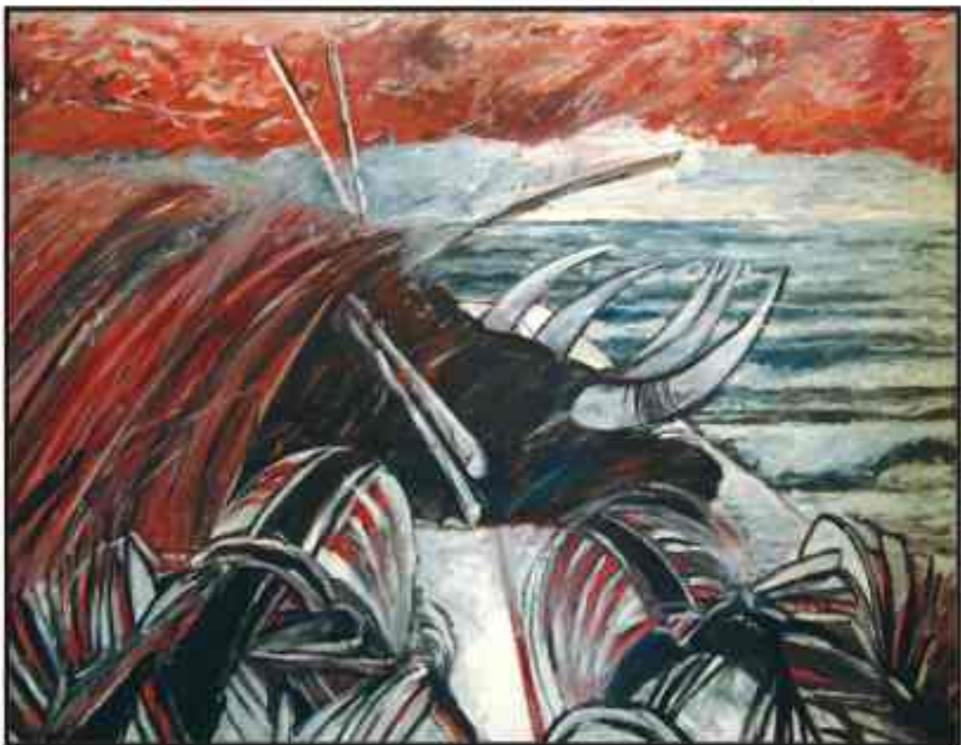
Din ciclul „Tauri“ ulei/pânză, 100/130