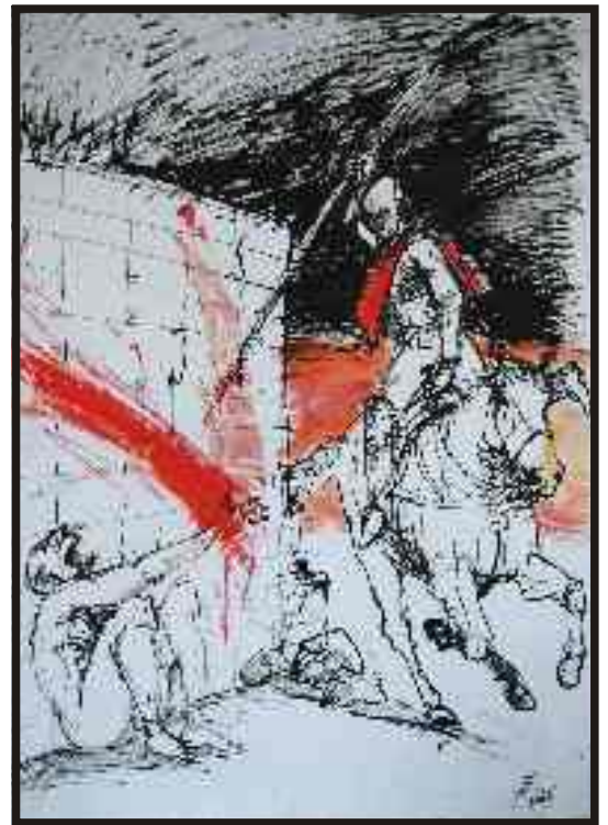
Din ciclul „Războiul“ tuș/hârtie, 50/40 cm