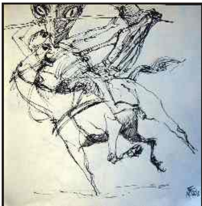
Din ciclul "Războiul" tuș pe hârtie, 30/30 cm