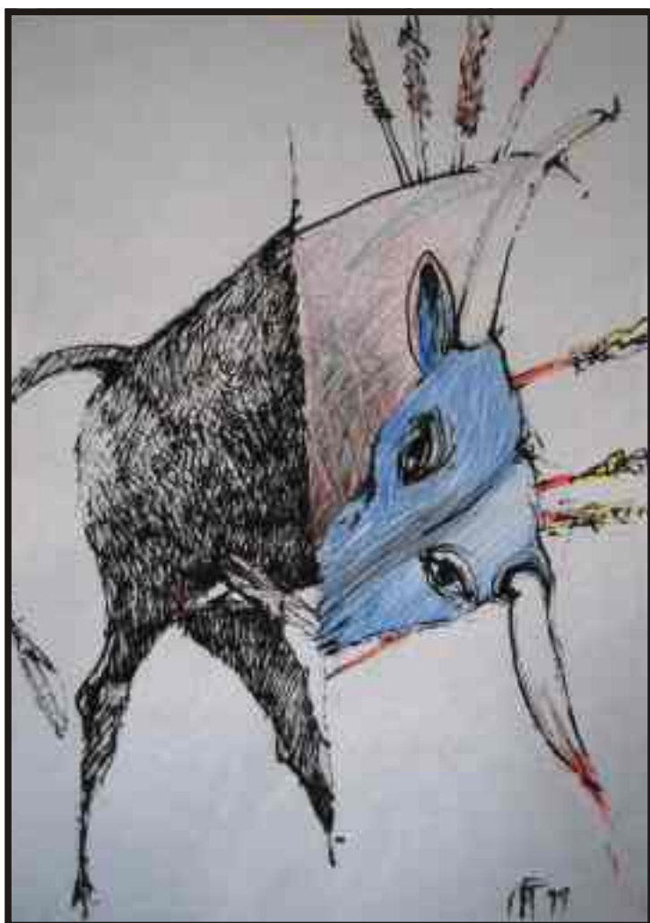
Din ciclul “Tauri” tehnică mixtă, 40/30 cm