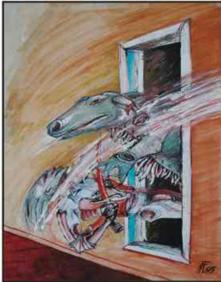
Din ciclul "Războiul" tehnică mixtă, 40/30 cm