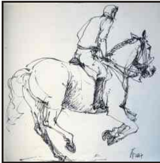
Din ciclul „Cai în sport“ tuș/hârtie, 30/30