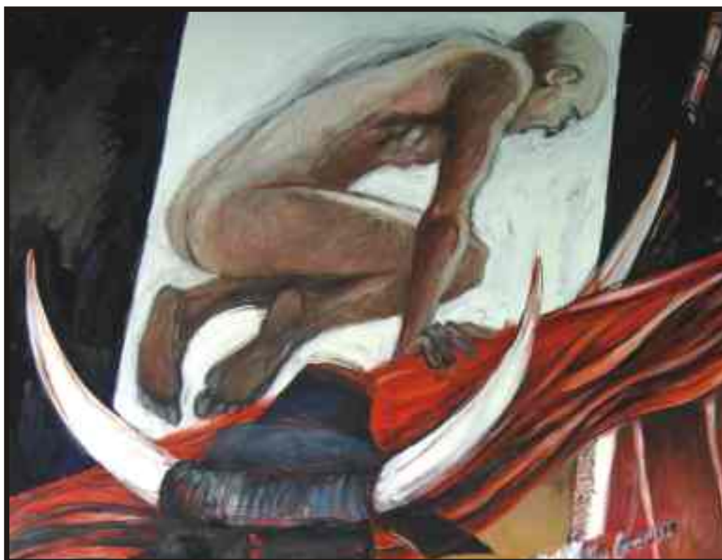
Din ciclul „Eroul relativ“ ulei/pânză, 130/400 (detaliu)