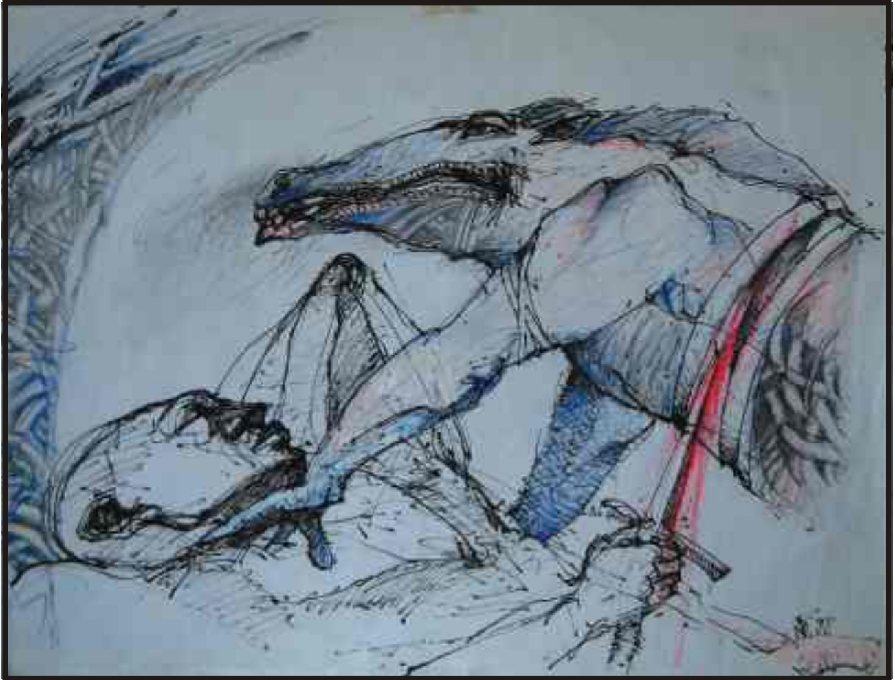
Din ciclul „R[zboiul“ tehnică mixtă, 40/30 cm