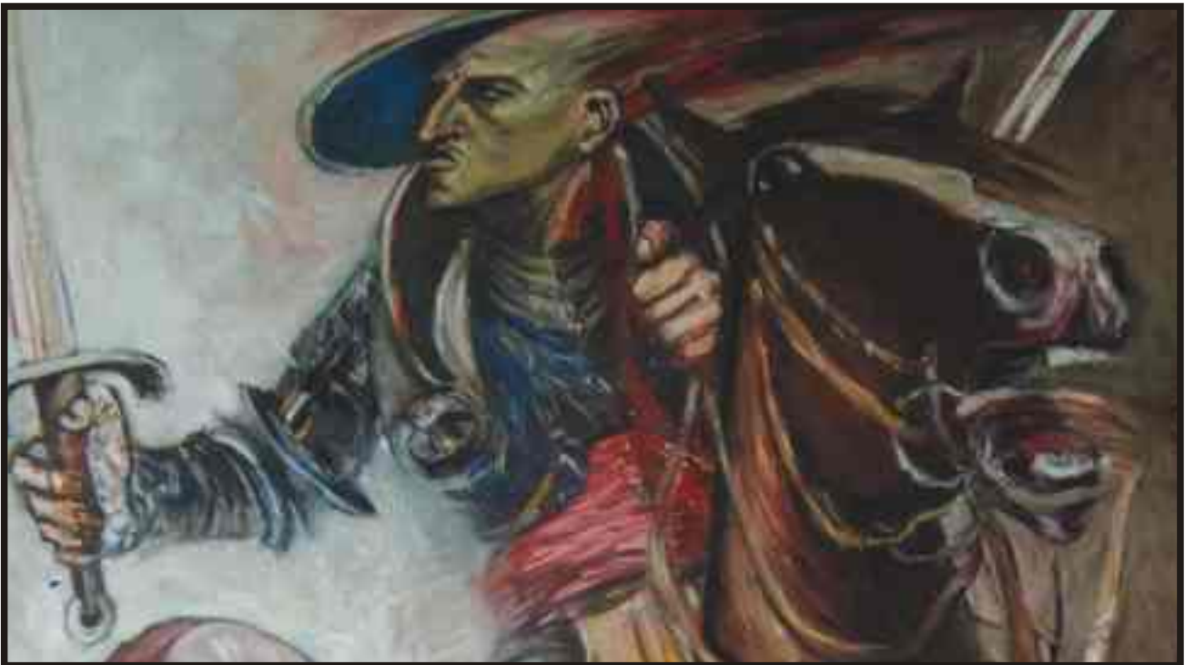
Din ciclul „Eroul relativ“ ulei/pânză, 100/100 (detaliu)