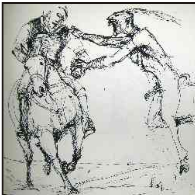
Din ciclul "Războiul" tuș pe hârtie, 30/30 cm