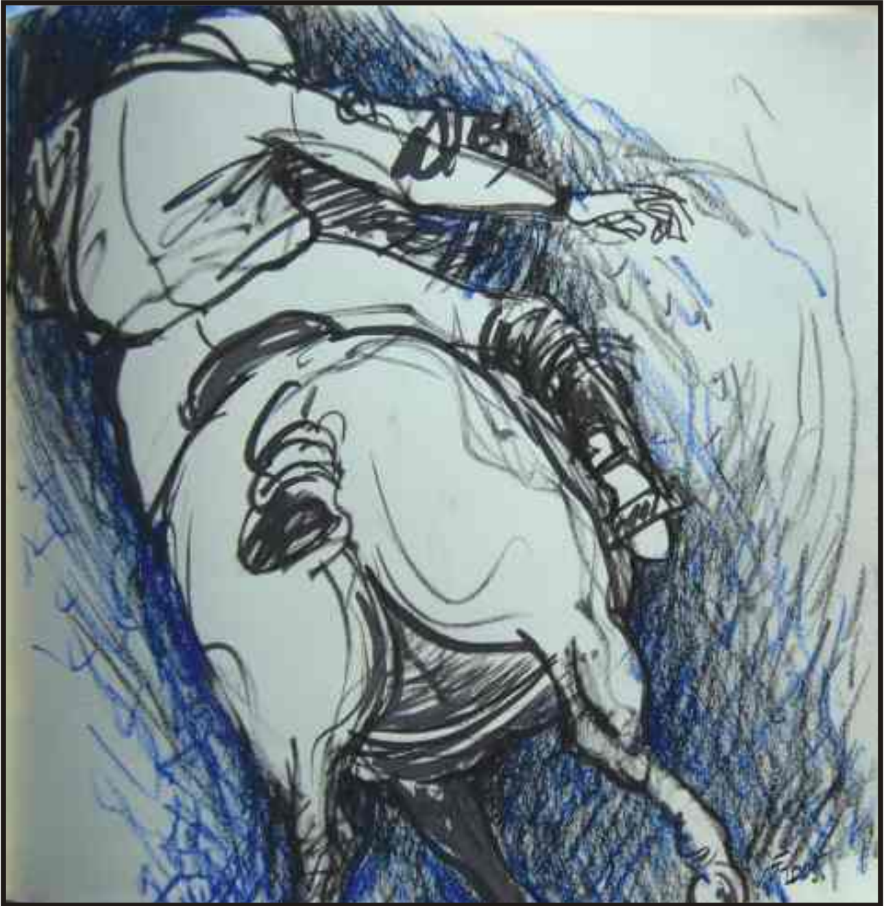
Din ciclul “Cai în sport” tehnică mixtă, 30/30 cm