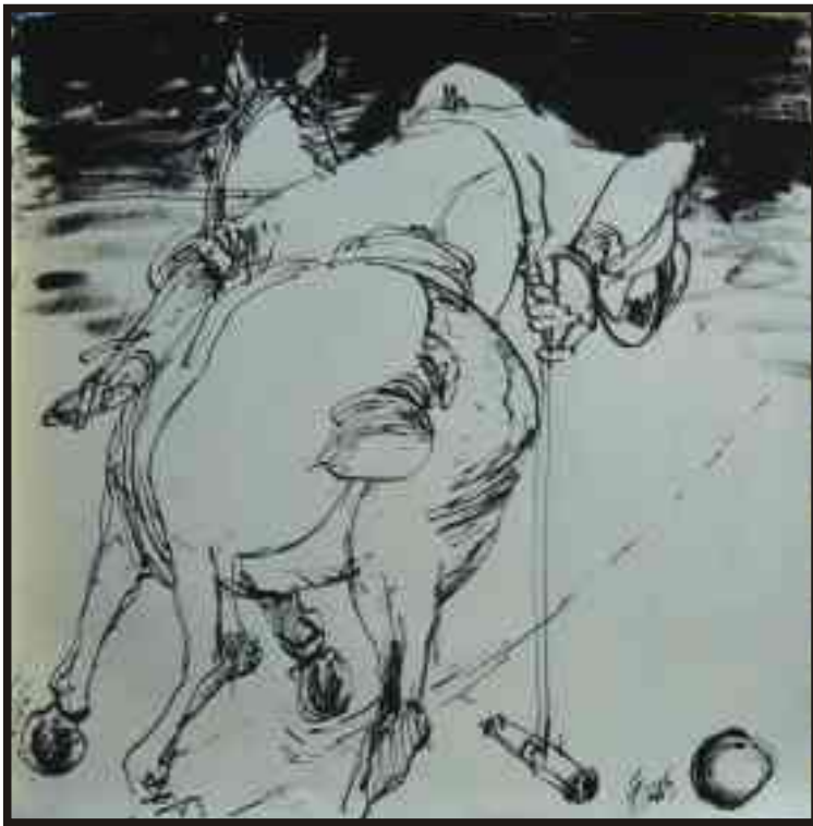
Din ciclul „Cai în sport“ tuș/hârtie, 30/30 cm