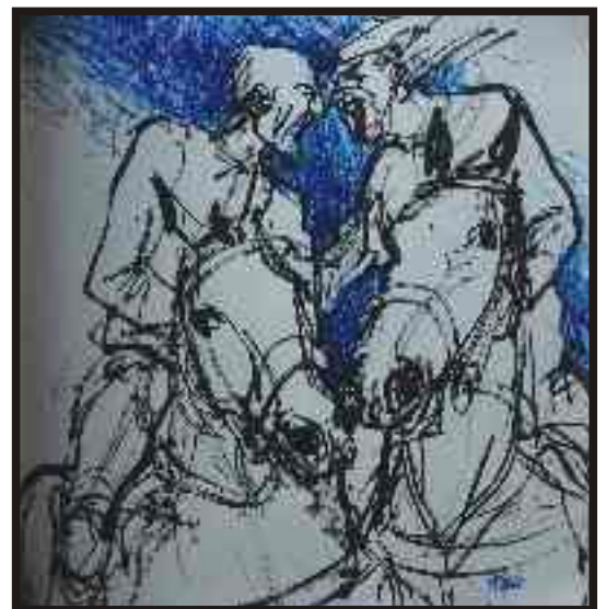
Din ciclul „Cai în sport“ tuș/hârtie, 30/30 cm