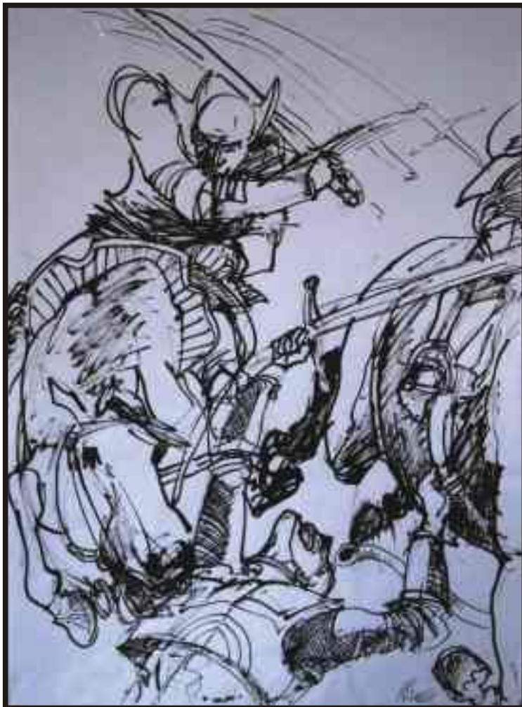
Din ciclul „Războiul“ tuș/hârtie, 40/30 cm