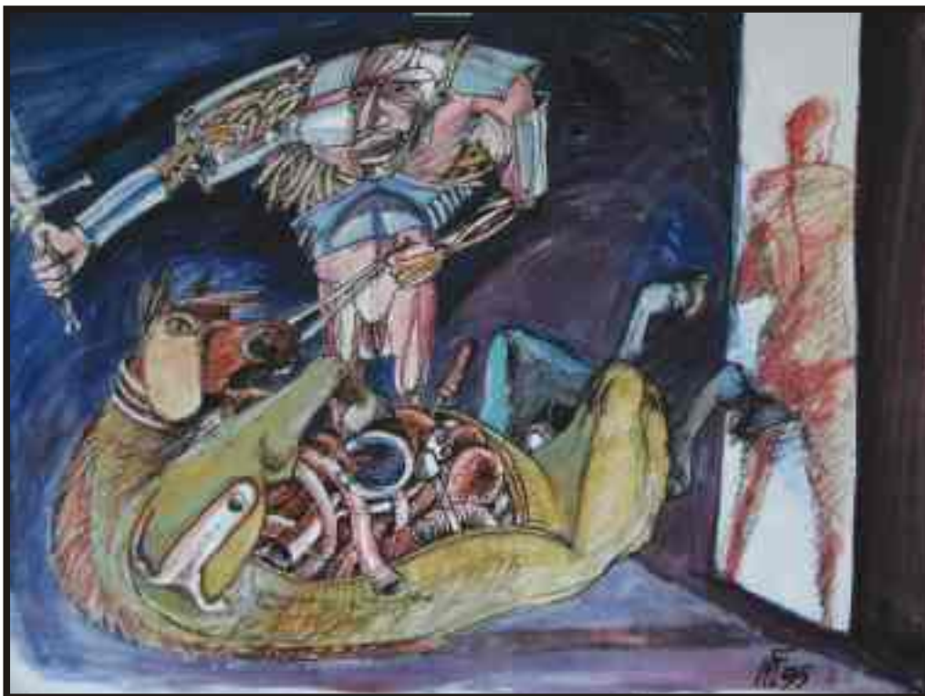
Din ciclul „Războiul“ tehnică mixtă, 30/40 cm