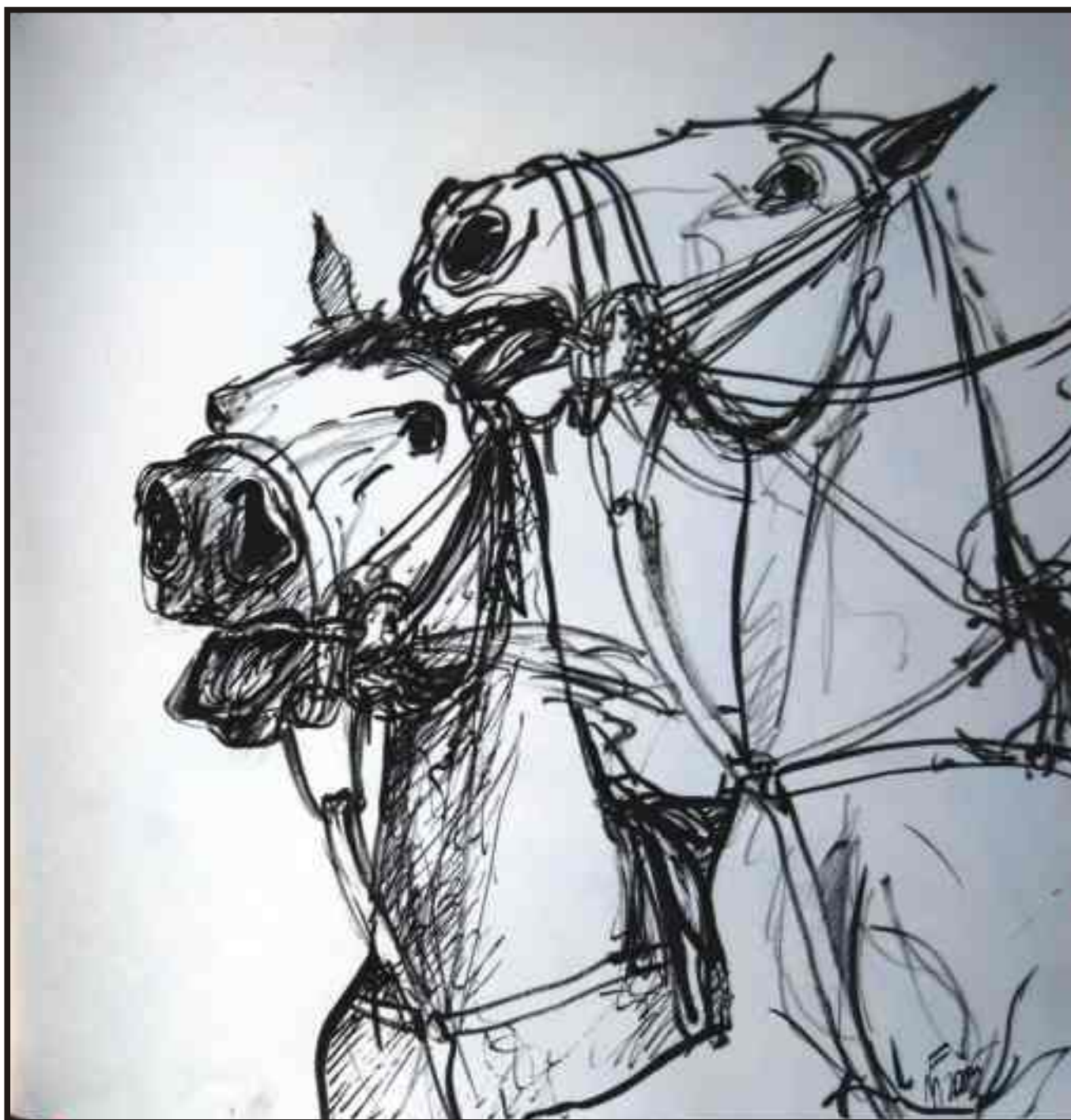
Din ciclul „Cai în sport“ tuș/hârtie, 30/30 cm