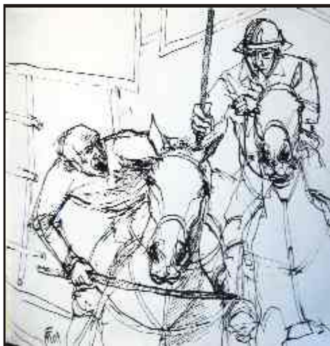
Din ciclul „Cai în sport“ tuș/hârtie, 30/30