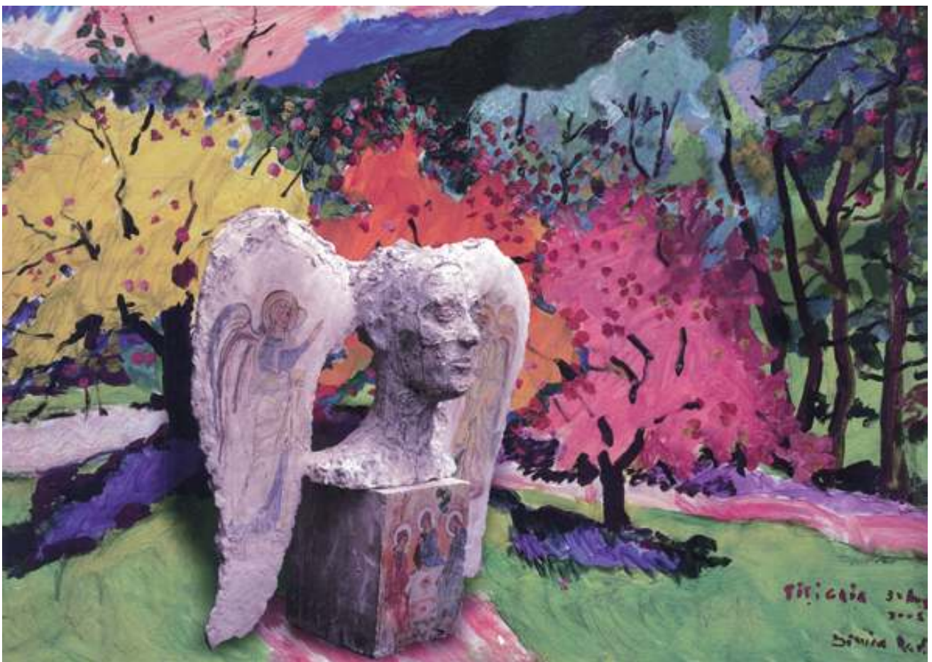
Îngeri în peisaj