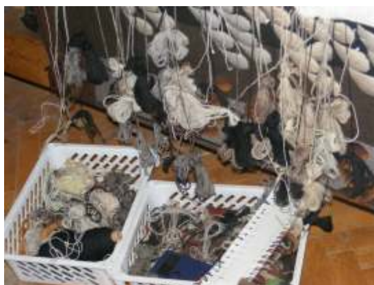
Firele timpului din atelier

Cela Neamtu 15 Februarie 2010 Gruu, Romania