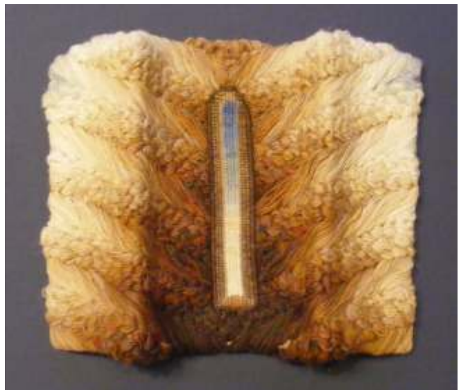
Coloane de Piciorul Lupului