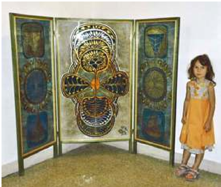
Începutul - Pomul vieții