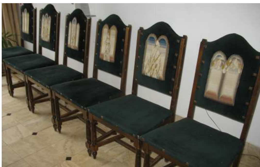
Interior la Gruu