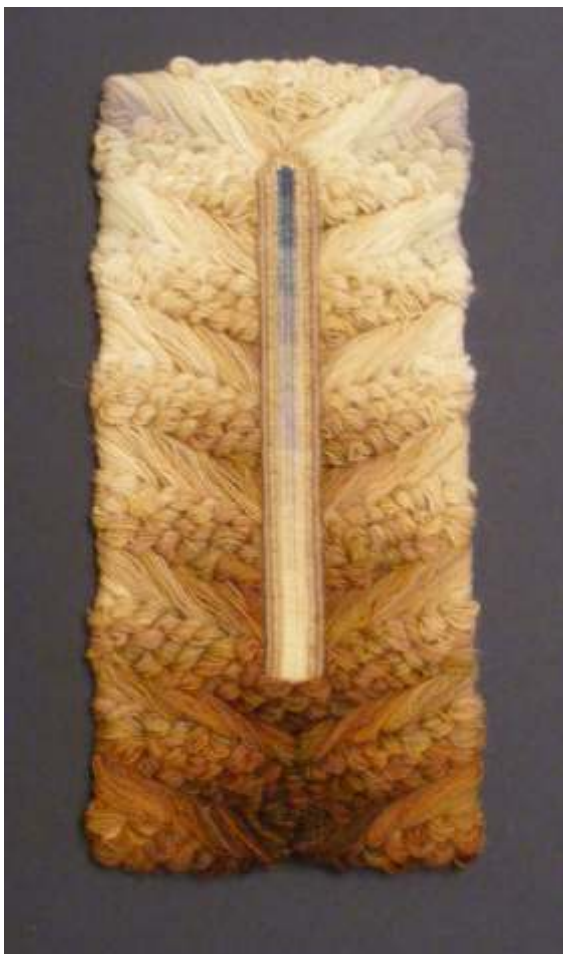
Ferestre pentru Z