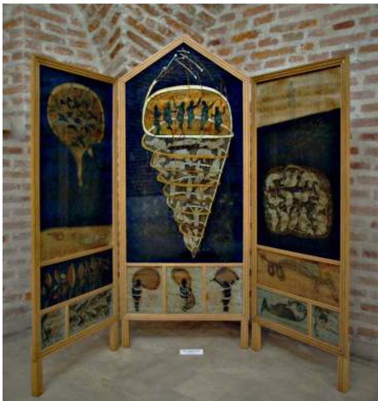
Infernul, Paradisul, Purgatoriul - (Dante)