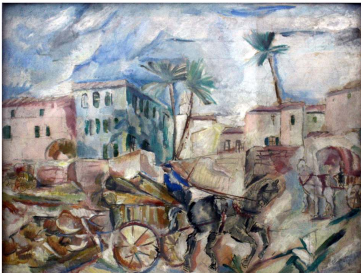
Elena Popea Peisaj din Spania ulei pe carton 48/51 cm