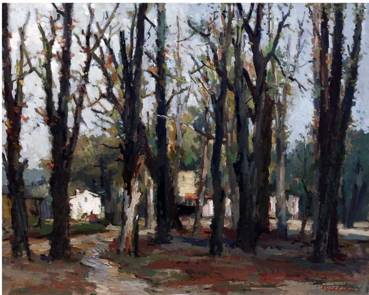
Adam Bălțatu Peisaj ulei pe carton 60/75 cm