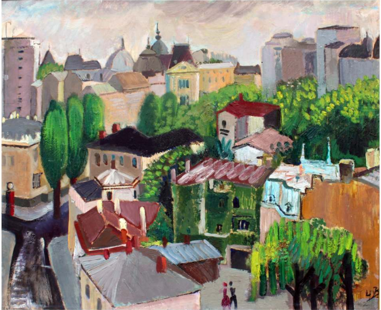
Micaela Eleutheriade Peisaj citadin ulei pe pânză 33/75 cm