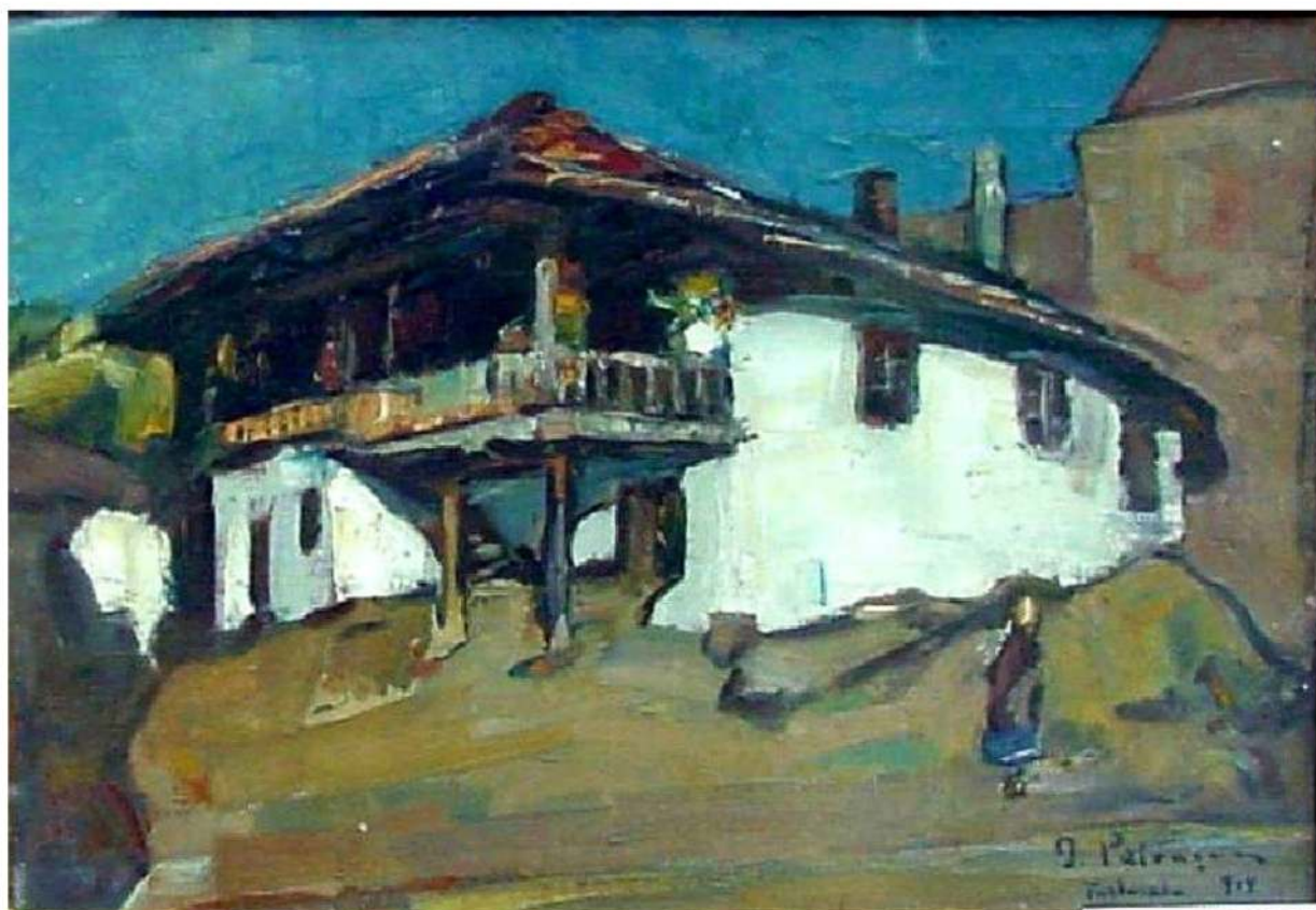
Gheorghe Petrașcu Casă la Turtucaia ulei pe pânză 33/49 cm