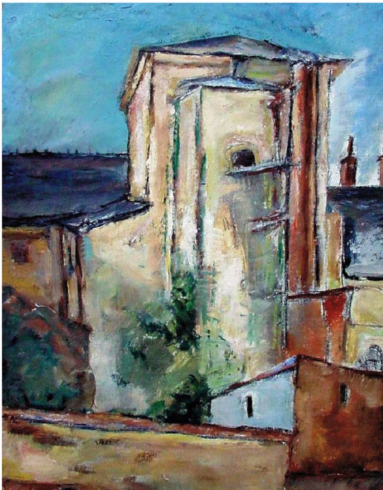
Vasile Popescu Casă din Dobrogea ulei pe carton 50/40 cm