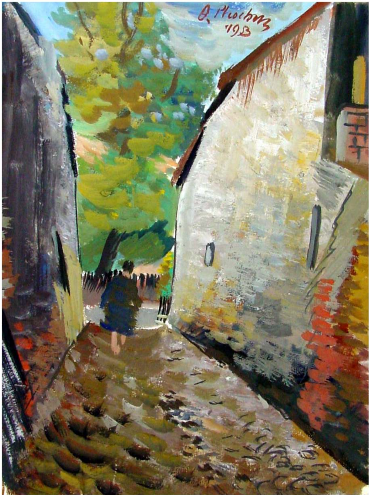
Alexandru Phoebus Casă veche în București guasa 36/26 cm