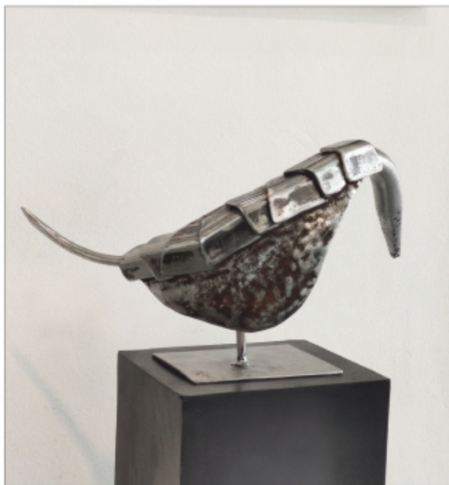
"Aspida" Eduard Costandache