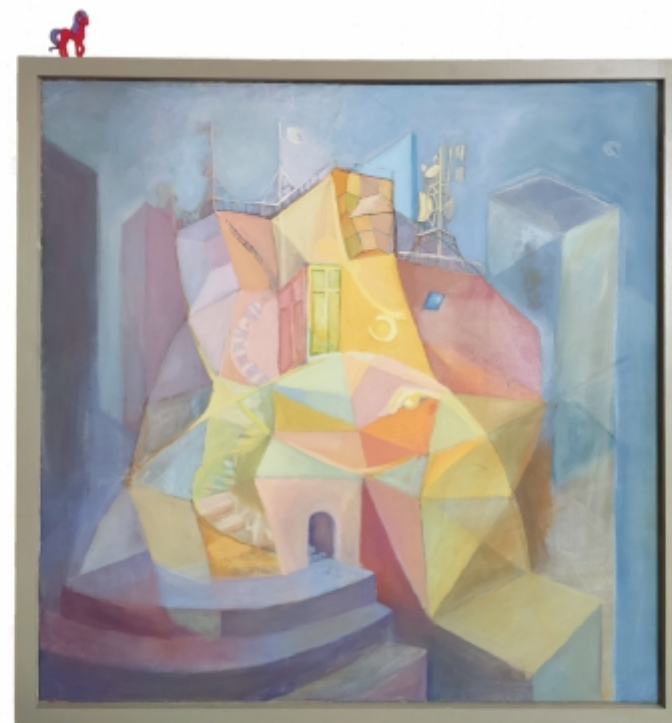
"Ieșirea din plan" Andreea Costandache