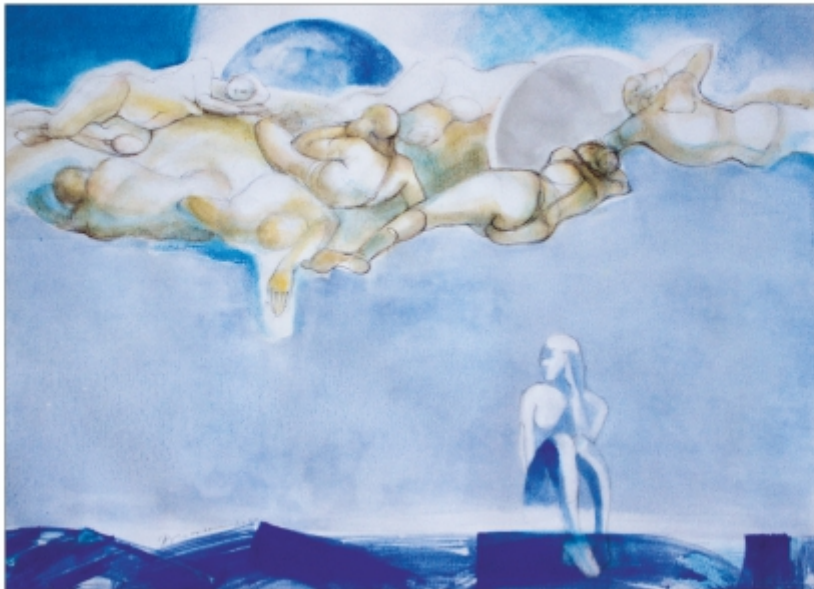
"Pe cer" Mihaela Brumar