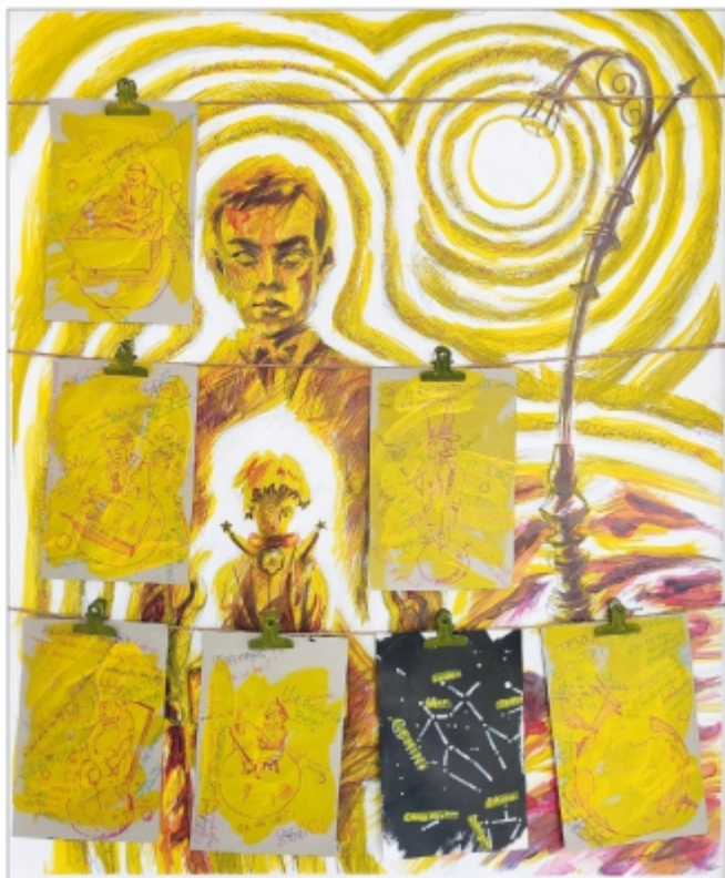
"Ego-inter-prins sau Inter Ego Prinț" Tudor Șerban