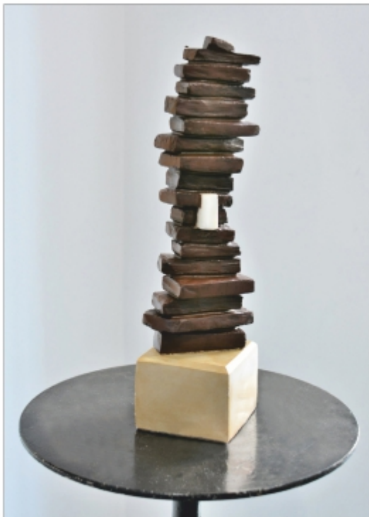
"Captiv" Valentin Popa