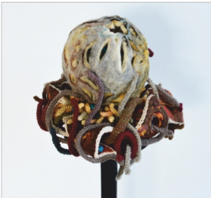
"Semințe de albastru" Sorina Vădeanu