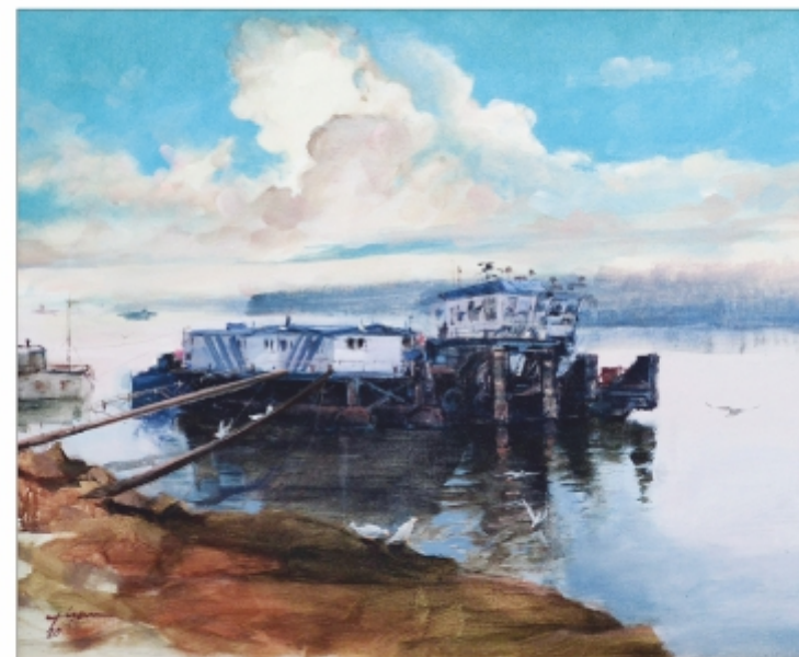
"Peisaj la Dunăre" Theodor Vișan