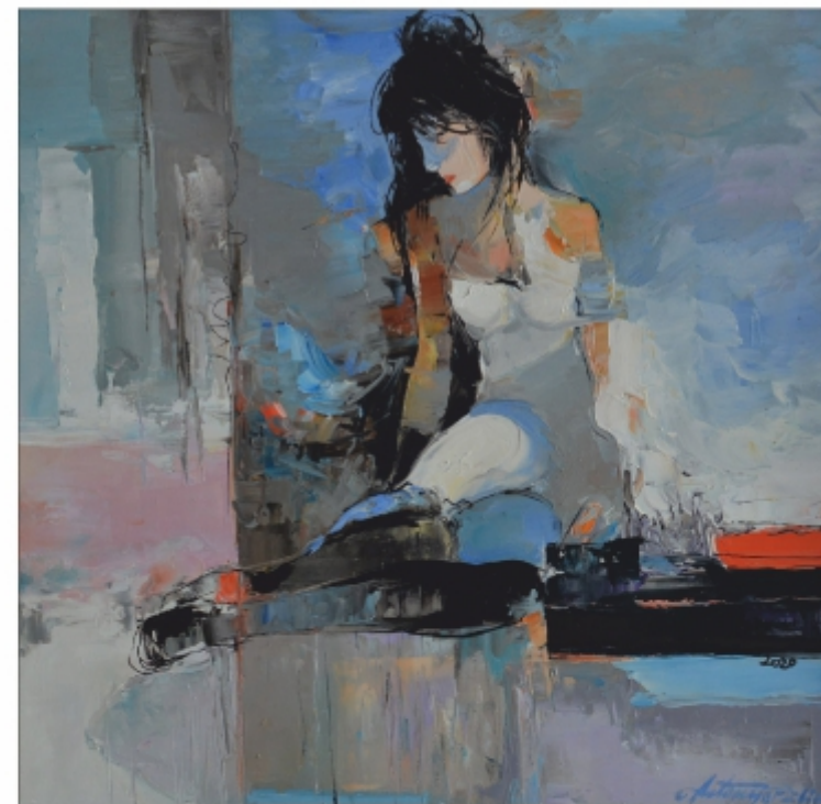
"Lady Faith image" Antonio Pălie