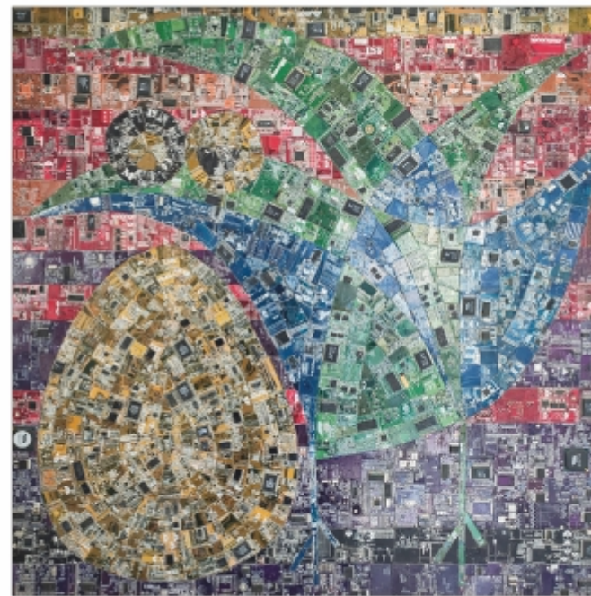
"Pasărea albastră și oul fericirii" Eduard Coman