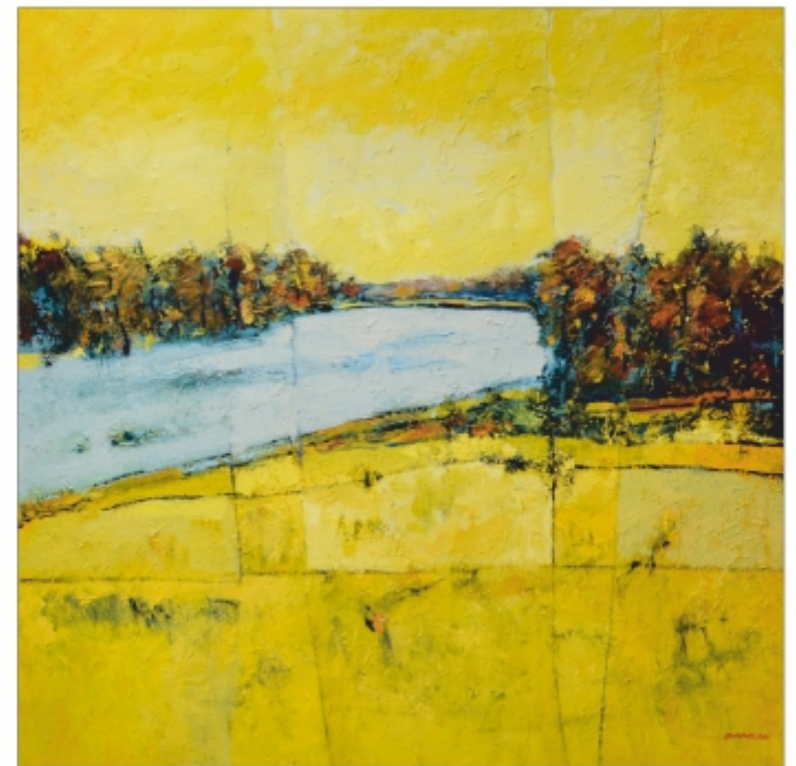
"Privalul mare" Sterică Bădălan