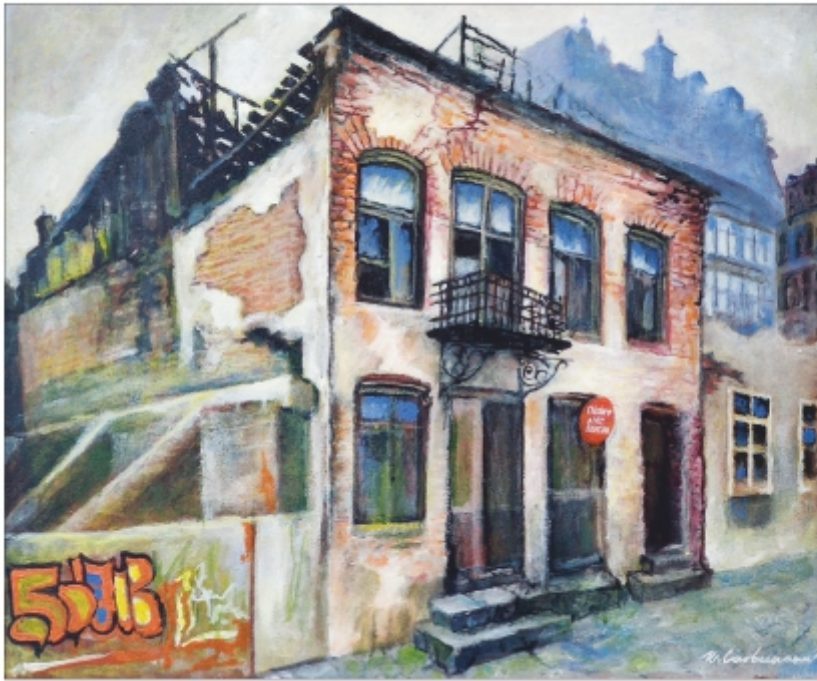
"Bulina roșie" Nicolae Cărbunaru