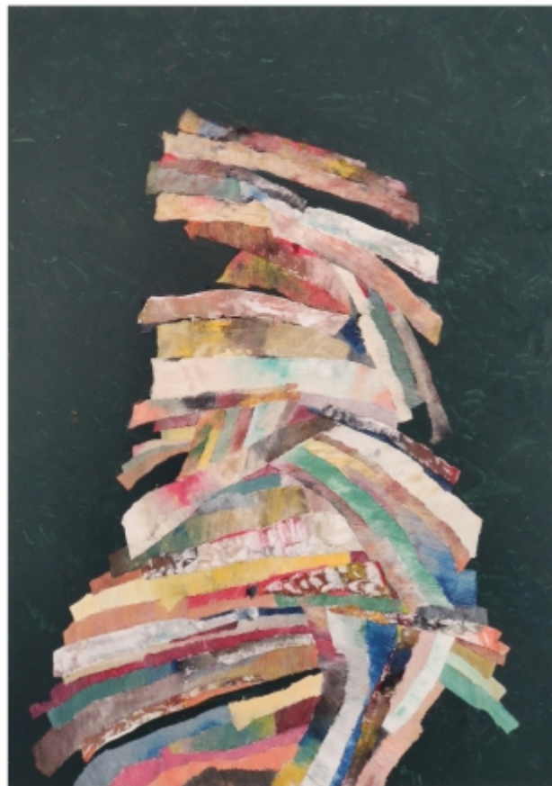
"Claie" Basarab Păltânea