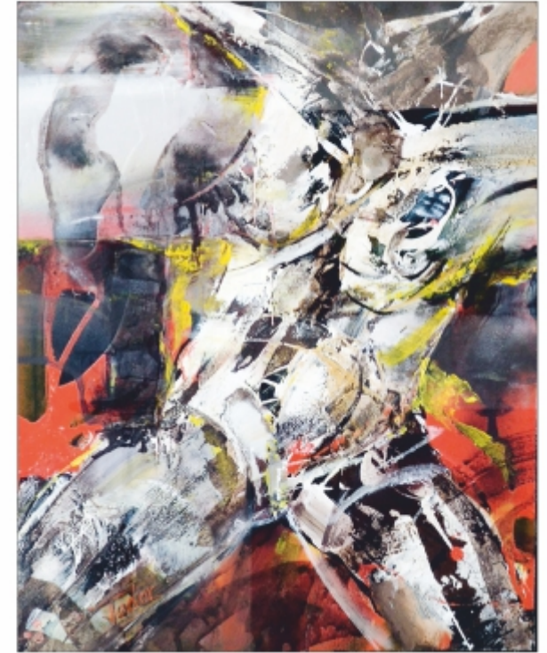
"Tors" Ioan Tudor