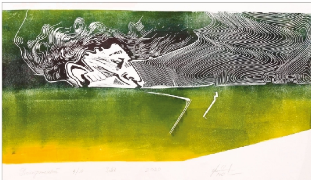
"Underjazz" Ionuț Mitrofan