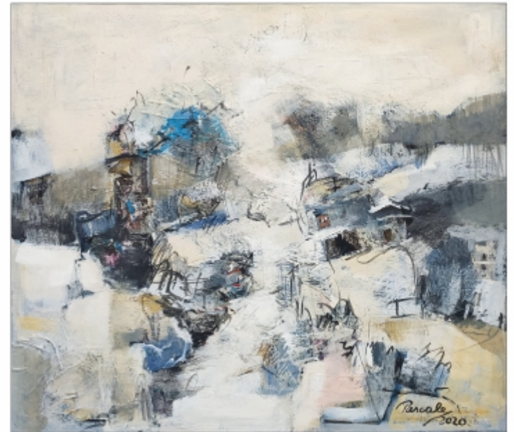
"Iarnă în Bucovina" Simona Pascale