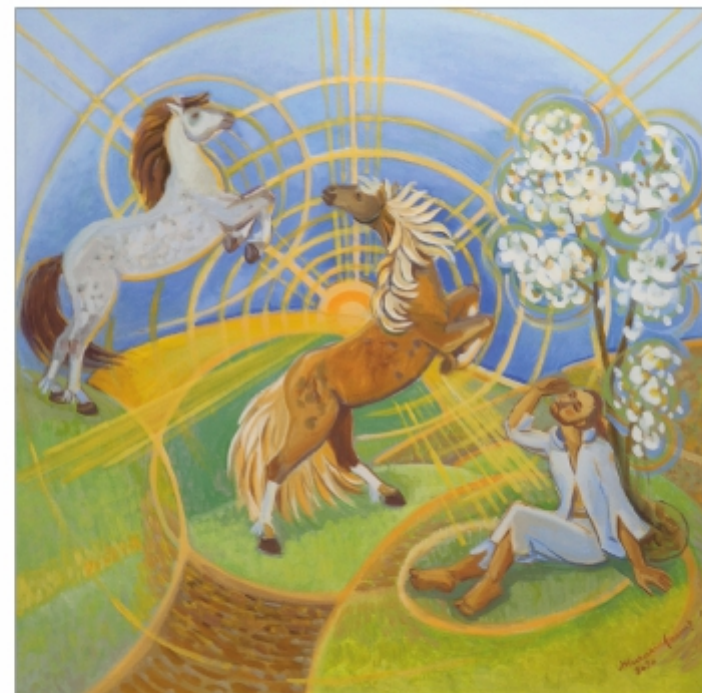
"Energii de primăvară" Ioan Murariu-Neamț