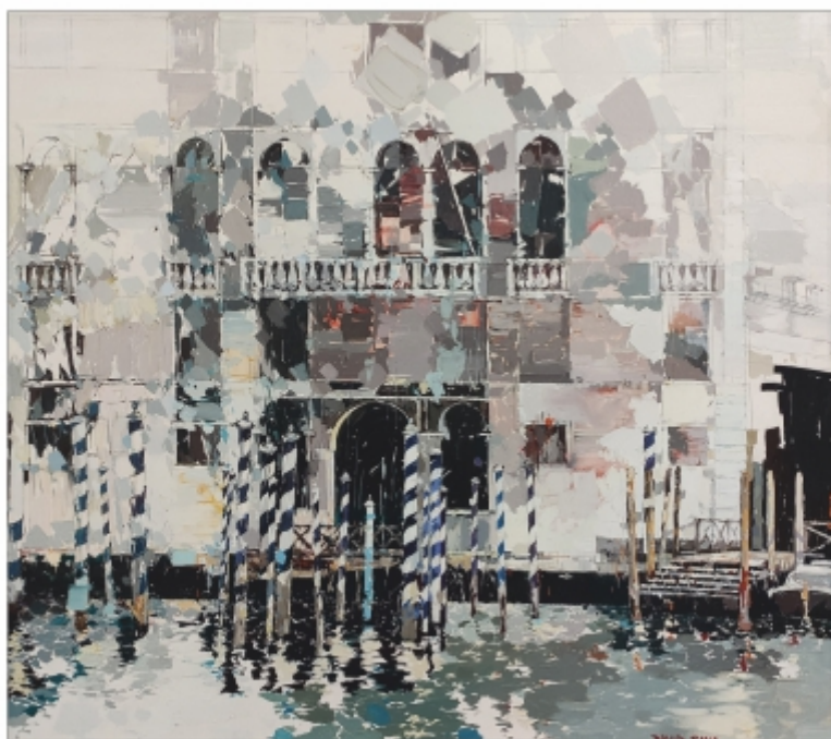
"Peisaj venețian" Sava David