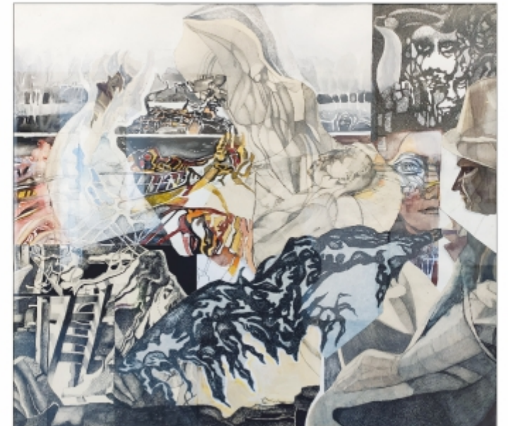
"Compoziție" Cornelia Burlacu